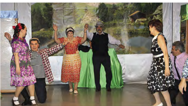
Постановка музыкальной комедии «Игеэктәр»