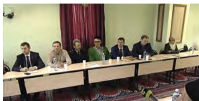
Круглый стол в мечети

В мечети Ноябрьска прошла встреча мусульман с представителями городских властей, ведомств и служб. Первым выступил руководитель территориального