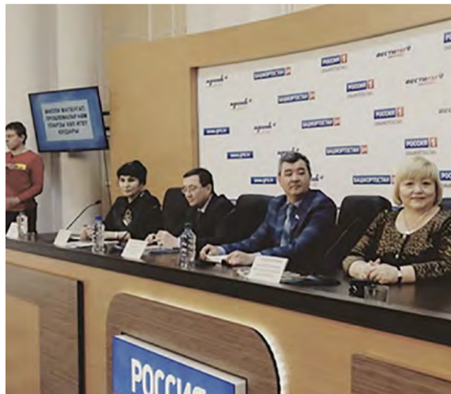
Милли-матбуғат йыйылышында бәхәсле мәл

сәнәғәт, мәҙәһиәт, спорт, мәктәптәрҙә уҡыу – уҡытыу мәсьәләләре буйынса әҙерләнеп эфирға сыккан тапшырыуҙарын бик кызыкһындырырлыҡ конфликтлы сюжеттарға королған һәм тамашасының талабына тулығынса яуап бирә. Һәр тема буйынса, һәр сығыш яһауыға аһык һорауҙар биреп, тулығы йыйнак композицион алымдар кулланып тамашасыға еткерәүгә өлгәһә алығы уны актив һәм бөтә ятқан да өлгөр һәм оператив журналист булығын күрһәтә. Әлеге мәлдә Башкортостан матбуғатына кағылығылы мәсьәләләр бик күп. Уны бер ярты сәғәтлек тапшырыуға ғына аһып һалуы мөмкин түгел. Беренһенән, жанр мөмкинлектәре лә, телевидион эфир ваҡыттары ла, алып барыуы менән берҙәй сығыш яһауыһының фекерләү дйрәһен сикләй. Матбуғатка, һөмүмән гәзетә – журналдарға язылуы проблемаларына кағылығылы телевидион тапшырыуҙарҙы киләһәктә лә карарға һасип булығын.